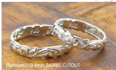
Platinum 950 4mm BARREL CUTOUT