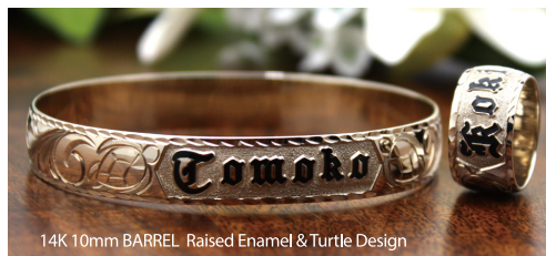
14K 10mm BARREL Raised Enamel & Turtle Design