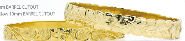
14K Yellow 8mm BARREL CUTOUT 14K Yellow 10mm BARREL CUTOUT