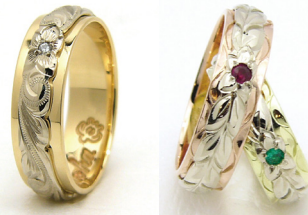
STRAIGHT edge WAVE CUT edge