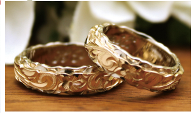
14K 4mm x 6mm FLAT Wave CUTOUT edge