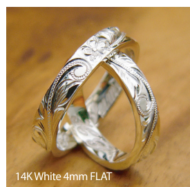
14K White 4mm FLAT