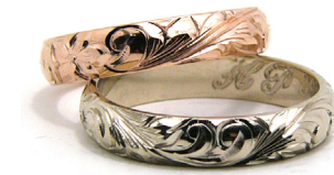
14K Rose 4mm / White 4mm BARREL