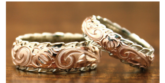
14K Rose & White 6 x 8mm Maile CUTOUT edge