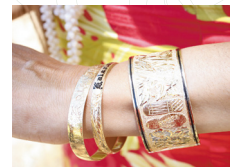
左から10mm, 8mm, 32mm幅