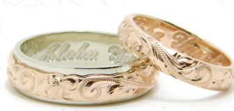
14K Rose & White 4 x 6mm TWOTONE 14K Rose 4mm BARREL